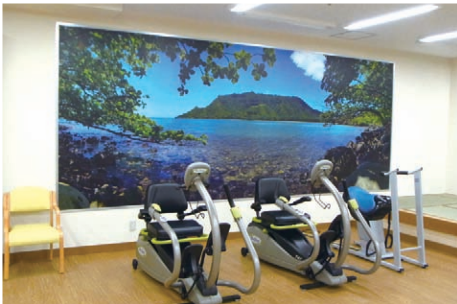
壁いっぱいの風景写真で心をなごませながら、ゆったり訓練していただけます