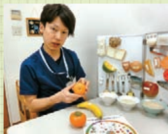
食品のサンプルや写真を使用した分かりやすいアドバイスを心がけています

また、必要に応じて継続的な栄養食事指導(月1回)も行っています。栄養士との面談で、翌日からのより高い目標を発見し、改善を続けている患者さまもいらっしゃいます。栄養食事指導をご希望の方は診察時に主治医へご相談ください。