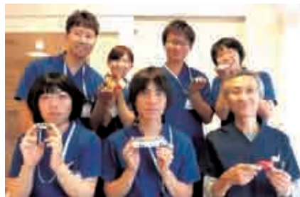
スタッフが丸となり、患者さまの安全運転を願って活動しています

今回は、当院が独自に行っている高次脳機能障害を持つ患者さまに対する自動車運転の評価について発表しました。