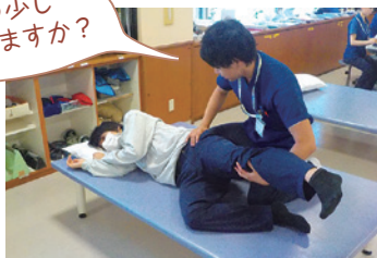
足の筋力を測定中です