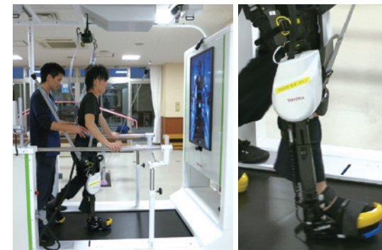
歩行練習アシスト（GEAR）