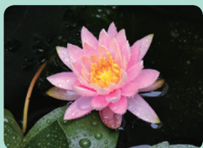
睡蓮 午前中にはきれいな花を咲かせてますが、昼過ぎには閉じてしまします