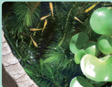
めだか 鉢の中にめだかがたくさん泳いでます。葉っぱの影に隠れていますので、探してみてください